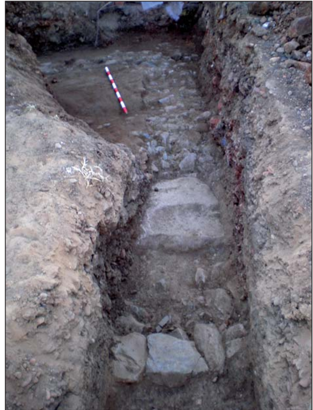
FIGURA 3 Detalle de A9.

Hacia el sector N de este edificio se localizó la primera deposición funeraria, una incineración en urna de plomo (A4). A escasos centímetros de la intersección de los dos muros se había excavado, en el geo-