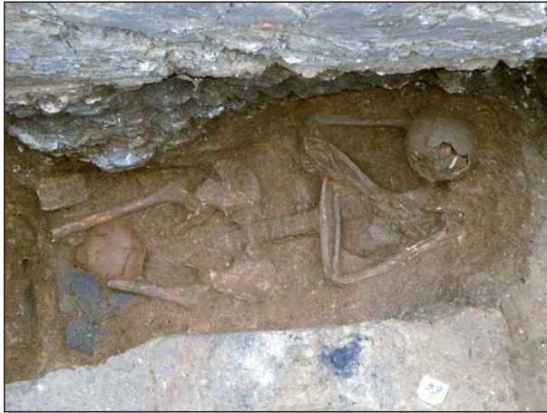
FIGURA 5 Inhumación A12.

constructivos latericios y opus signinum , tenía una potencia de aproximadamente 65 cm.