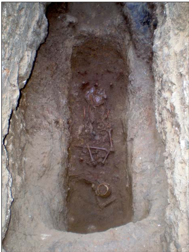
FIGURA 6 Inhumación A13.

aplanado a la altura del ojal. Tipológicamente corresponde a XIX-2 de Béal, fechando las más antiguas en la segunda mitad del s. I d.C., prolongándose hasta el V d.C.; junto a ella una ollita de cuerpo bitroncónico con dos asitas laterales. En la mano derecha sostenía una moneda ilegible (fig.6).